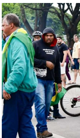
Imagem 2 – Imagem denominada “GESIVAL - DSC_3925 (1).jpg”.