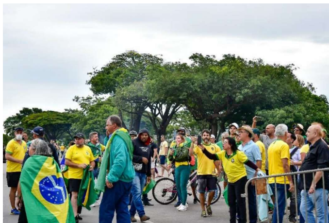
Imagem 1 – Imagem denominada “GESIVAL - DSC_3926.jpg”.