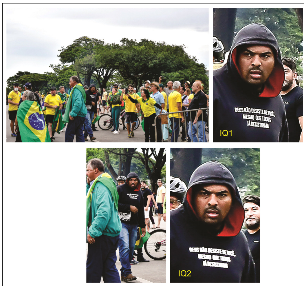
Figura 1 - Objetos de análise antes e pós processamento (IQ1 e IQ2).